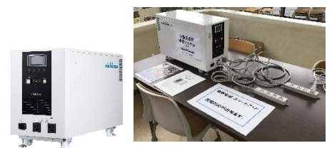
ポータブル蓄電システム