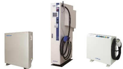
家庭用蓄電システム、急速充電器、V2Hシステム