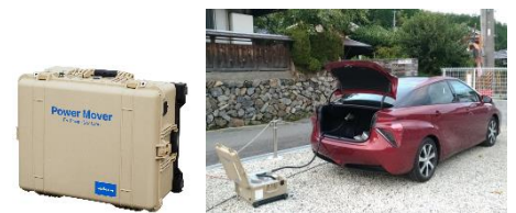
可搬型給電器パワー・ムーバー