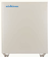
ESS-U2X1 (16.6kWh) ESS-U2M1 (11.1kWh)