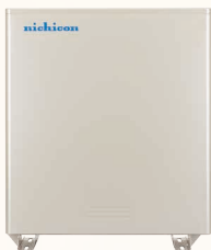
ESS-U4X1 (16.6kWh) ESS-U4M1 (11.1kWh)