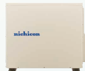
ESS-U3S1 (4.1kWh) ESS-U3S1J (4.1kWh)